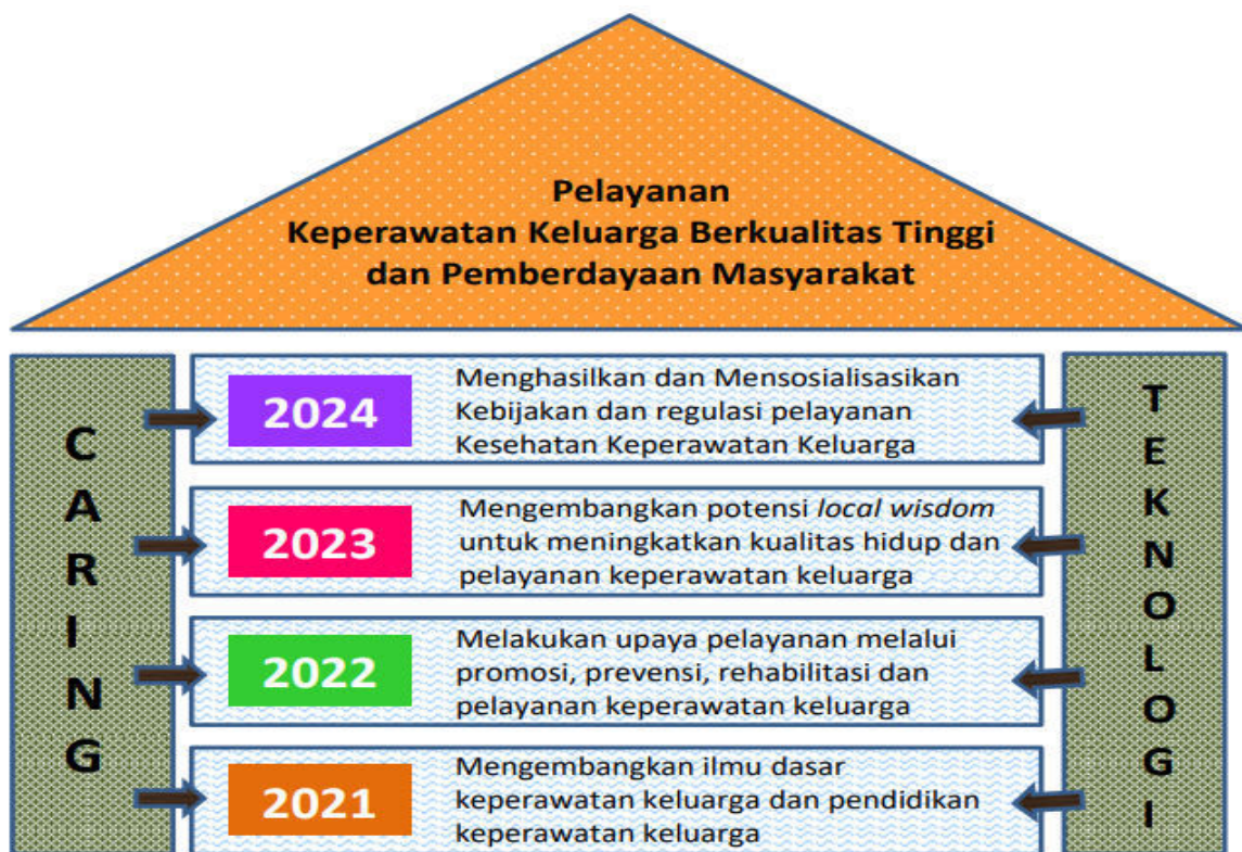
Gambar 3. Road Map Pengabdian kepada Masyarakat Akper Teungku Fakinah 2021-2025

Peta jalan ( Road Map ) Renstra Pengabdian kepada Masyarakat Akper Teungku Fakinah disajikan pada Gambar 3 di bawah ini.